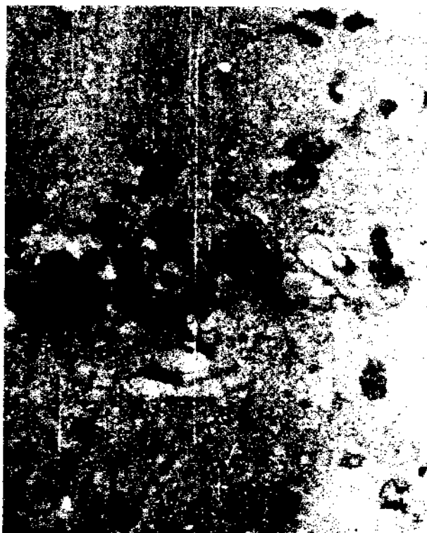
Fig. 2. Grupo experimental de 6 h. Se observa una zona más clara a la derecha, donde han desaparecido algunas neuronas y la que además, se aprecia edematosa (400 X).

La desmielinización encontrada, pudiera deberse a la presencia de un compuesto responsable de esa actividad, aunque quizás pueda estar relacionado con la severa destrucción